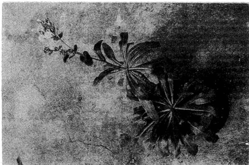
Fig. 3 Crepidiastrum daitoense TAWADA, sp. nov. ダイトウワダンの全形