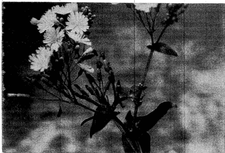
Fig. 2 Crepidiastrum daitoense TAWADA, sp. nov. ダイトウワダンの花序と上出葉