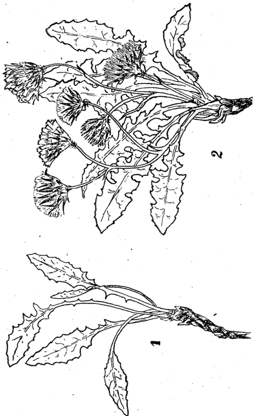
Crepis macedonica Kitan. — 1) Folia caudiculi (1/1); 2) Planta florifera (1/1); 3) Involucri phyllorum exteriorum et interiorum facies externa (4X); 4) Involucri phylli interni facies interna (4X); 5) Ligula (3X); 6) Achenium (5X).