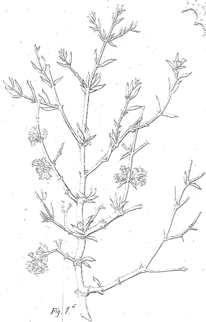
Fig. 1. a