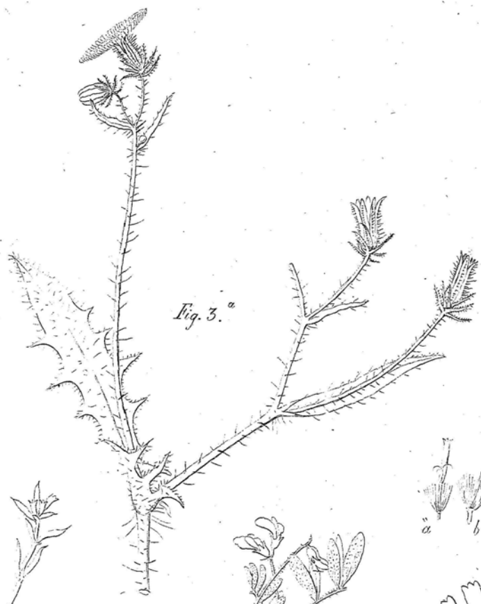
Fig. 3. a