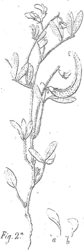
Fig. 2. a