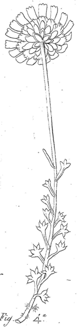
Fig. 4. a