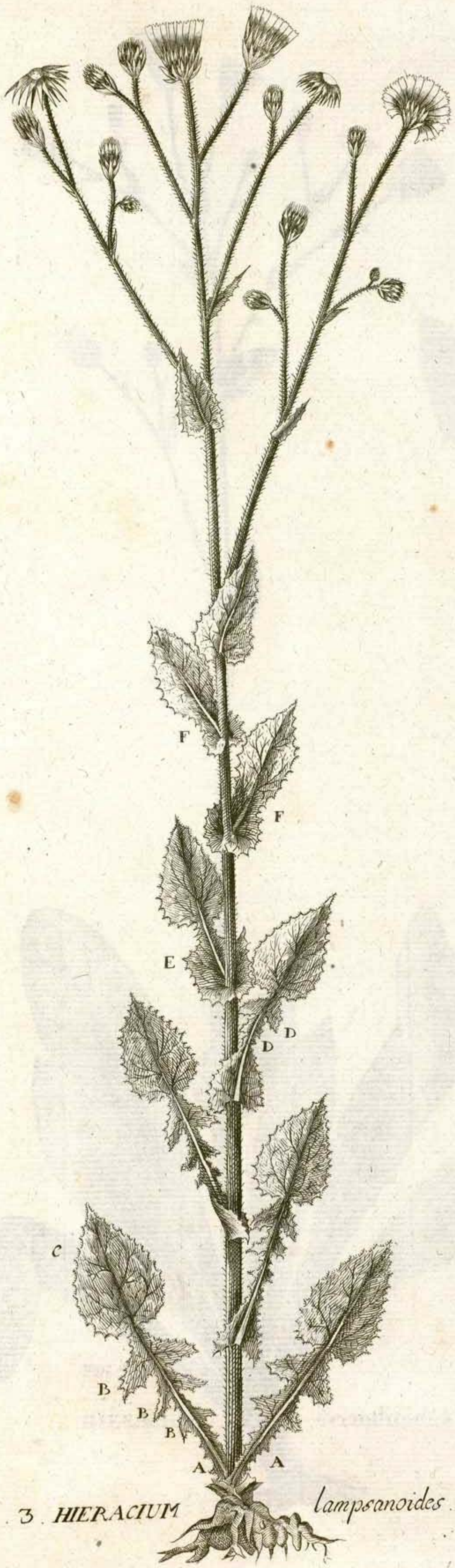
FIG. 3. HIERACIUM lamproanoides.