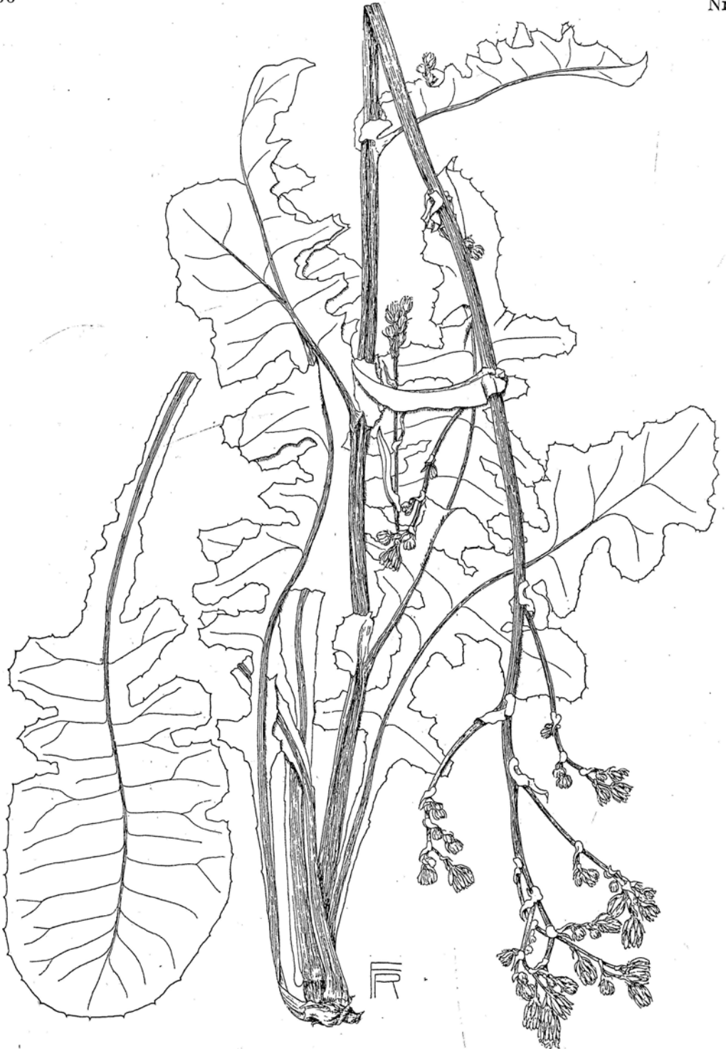
Fig. 142. Lactuca Edelbergii (E. 523, 524). \frac{1}{2} .