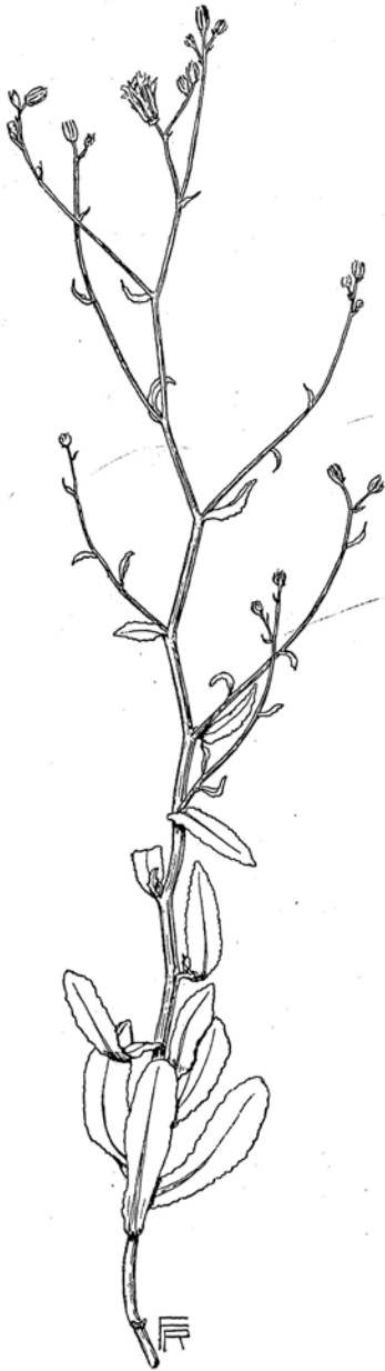
Fig. 144. Lactuca Koelzii (Kz. 12616). \frac{1}{2} .

divaricate intricate ramosissimus, pallide viridis teres glaber tenuiter striatus, omnino aphyllus, ad basin ramorum tantum squamis minutissimis triangulari-lanceolatis acuminatis herbaceis indistincte membranaceo-marginatis indivisis. Capitula in pedunculis 1—4 cm longis non incrassatis terminalia. Involucrum 7—8 mm longum, oligophyllum basi attenuatum superne \pm patulum; phylla exteriora valde abbreviata, triangulari-lanceolata, intima uniseriata aequalia 7—8 mm longa anguste lanceolata a basi apicem versus sensim angustata, tenuiter herbaceo-membranacea tenuissime longitudinaliter striata, glabra laevia, anguste hyaline marginata, apice subito paulum membranaceo-dilatata vel subcorniculata saepe purpurascens. Ligulae roseae vel lavandulaceae (e collectore) involucri subduplo longiores. Achaenia submatura 3—4 mm longa, leviter curvata, paulum compressa, basi attenuata apice breviter crasse rostrata, pallide brunea, tenuiter longitudinaliter striata. Pappus 4 mm longus, albus multiradiatus scabridulus. — Species aphylla habitu intricato-ramosissimo Launae acanthodi (Boiss.) O. Ktze vel Scorzonerae tortuosissimae Boiss. simillima, Chondrilla piestocarpae Boiss. (mihi e descr. tantum notae) quoque similis videtur sed characteribus involucri et achaeniorum potius Lactucae sect. Scariolae adnumeranda.