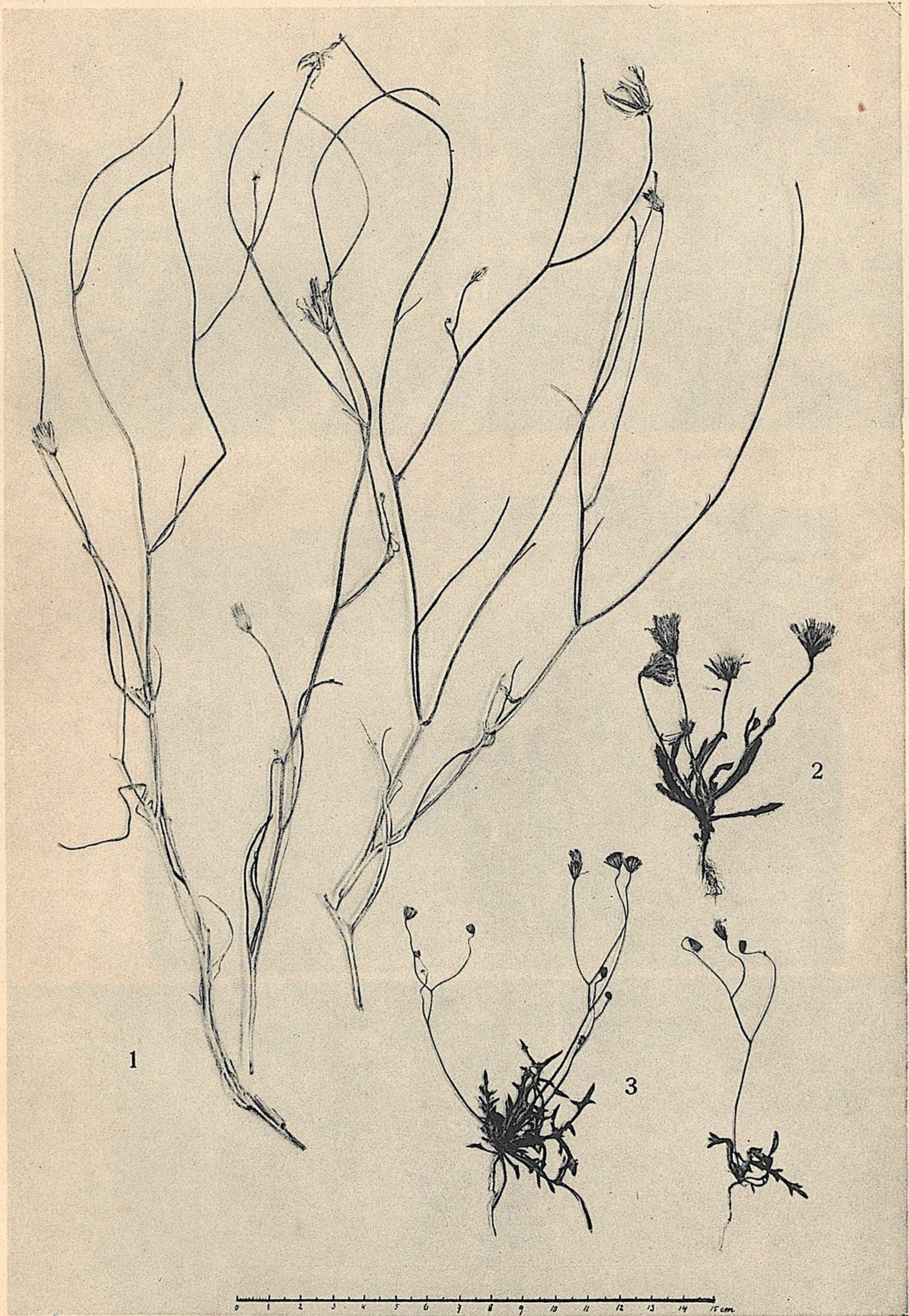
1. Scorzonera intricata Boiss. var. Petraea Nk. — 2. Picris desertorum Nk. — 3. Lagoseris Marschalliana (Rchb.) Hand.-Mzt. var. leptocaulis Nk.