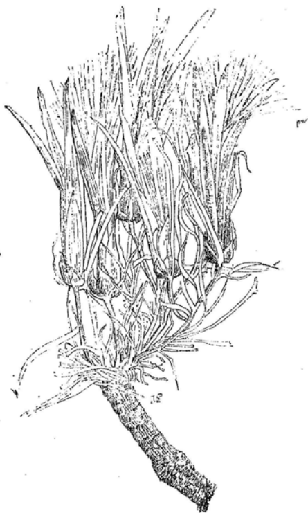
Fig. 2. Scorzonera Albertoregelia C-Winkl. (аутентичный экземпляр).

rum apices vel ad pedicellos abbreviatis ex axillis foliorum summorum abeuntibus, rarissime subverticillatis solitario posita. Flores in vivo flavii, dessicatione causa paulo erubescens. Involucry phylla pluriserialia, coriacea, supra mucido pubescentia demum denudata; exteriora minuta deltoidea vel deltoideotriangularia subcarinata, media ovato oblonga, intima elongato linearia dorso subcarinata, apicibus obtusis, marginibus brevissime albomembranaceis. Achenia ad 7 mm. longa, laevia, glabra, striata. Pappus sordidus. setis mollibus. plumosis, quinque longioribus, basi scabridis.