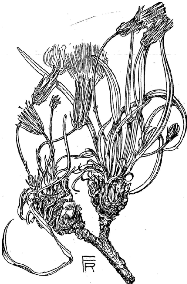
Fig. 134. Scorzonera Koeieana (K. 3309). \frac{1}{4} .

Sect. Euscorzonera DC. Subsect. Pulvinares Boiss. — Perennis caespitosa collo incrassato minute squamoso inter squamas lanato. Folia omnia basalia scapos aequantia vel paulo superantia, ad 8 cm longa, anguste lanceolato-lineararia, basi apiceque sensim attenuata, basi ipsa membranaceo-dilatata, supra medium plerumque latissima ad 3 mm lata integerrima, crassiuscula, trinervia, saepe in sicco longitudinaliter plicata et subfalcato-curvata, prope basin villosula, ceterum appressissime breviter puberula. Caules tenues ad 8 cm longi, tenuiter sulcato-striati, scapiformes vel foliis rudimentariis anguste lanceolato-linearibus \pm squamiformibus sparse obsiti. Involucrum floriferum \pm 12 mm longum, in vivo verosimiliter cylindricum, basi breviter rotundatum, fructiferum valde elongatum ad 25 mm longum, phyllis non numerosis irregulariter subseriato-imbricatis; phylla omnia herbacea, anguste membranaceo-marginata, nervo unico tenui percursa, minute appresse farinoso-puberula, imprimis apicem versus glabrescentia; exteriora \pm 7 lanceolata acuta 3—5 mm longa; interiora 5—7 circiter triplo longiora basi ad 3 mm lata saepe subaequalia vel longitudine inter se paulum diversa. Ligulae