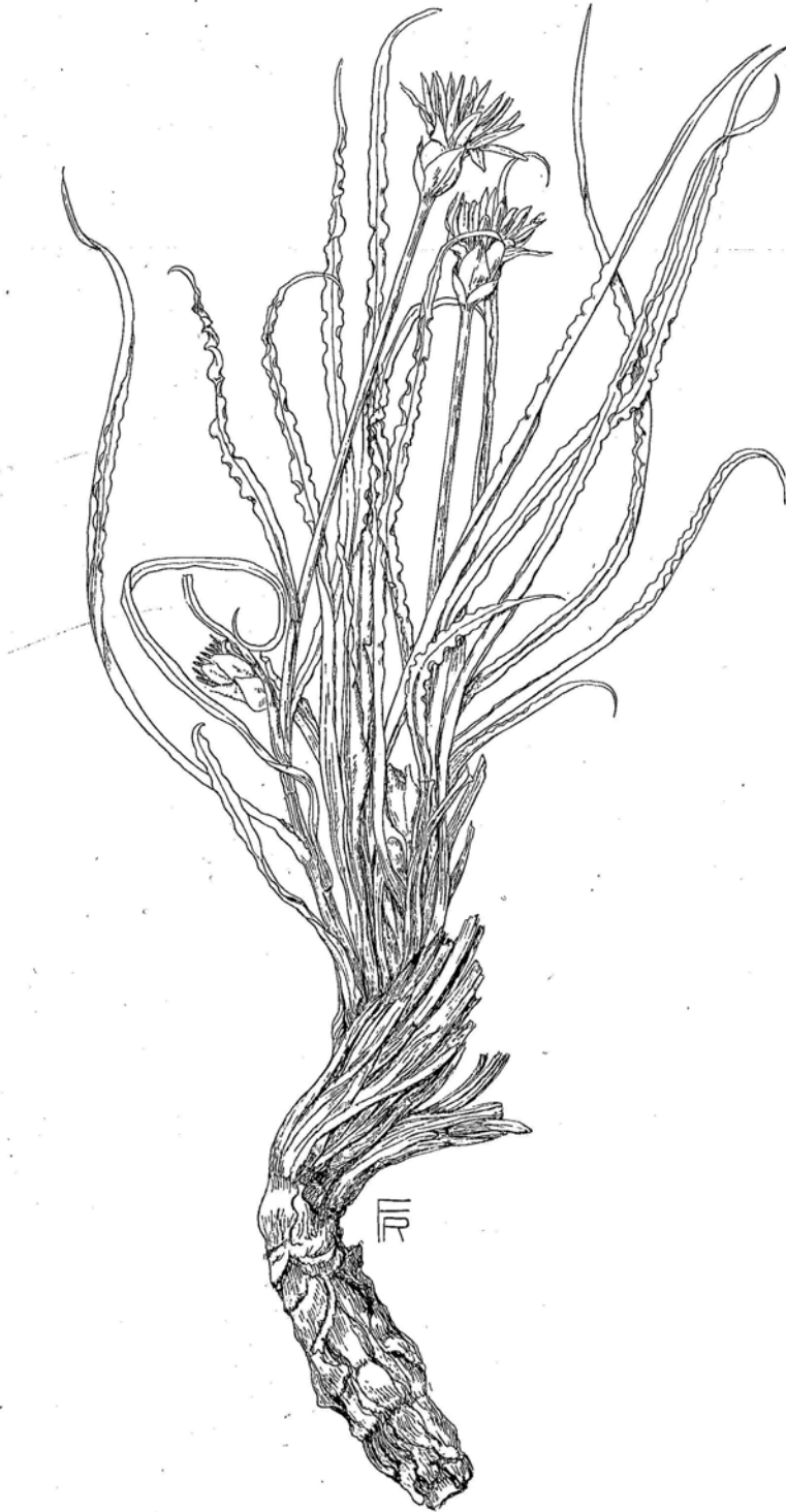
Fig. 136. Scorzonera tunicata (K. 3710). \frac{1}{2} .