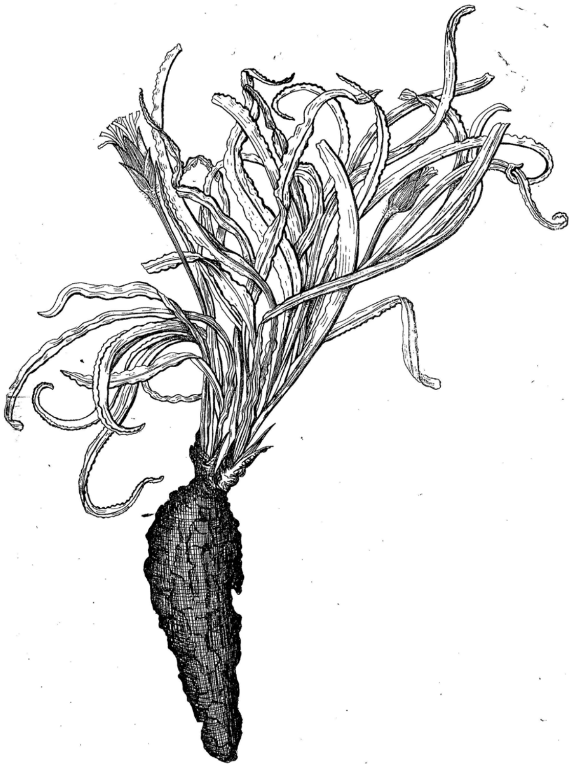
Tab. 31. Scorzonera Turkeviczi H. Krasch. et Lipsch. sp. nova (habitus; \frac{2}{3} ).