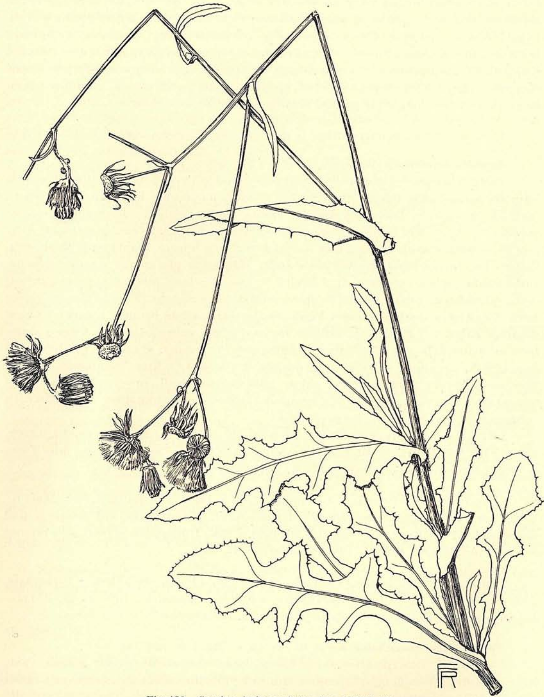
Fig. 139. Sonchus lachnocephalus (Kz. 11588). \frac{2}{3} .