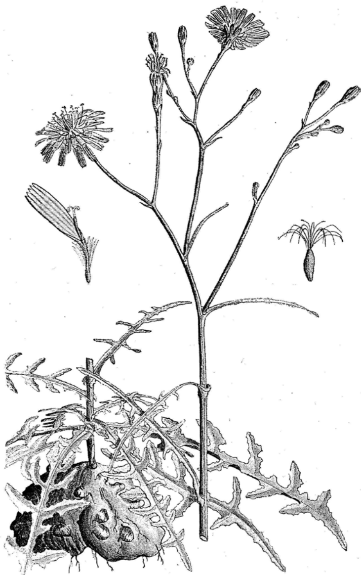
Sonchus tuberosus Svent.