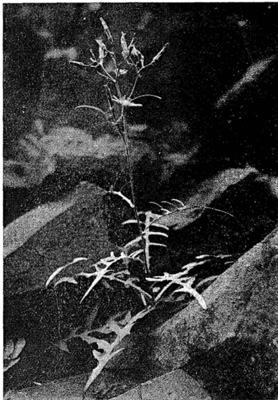
Sonchus tuberifer Svent.

Foliis runcinato-pinnatipartitis, inferioribus glabris, superioribus leviter pubescentibus, virido-glauciscentibus; divisionibus remote al-