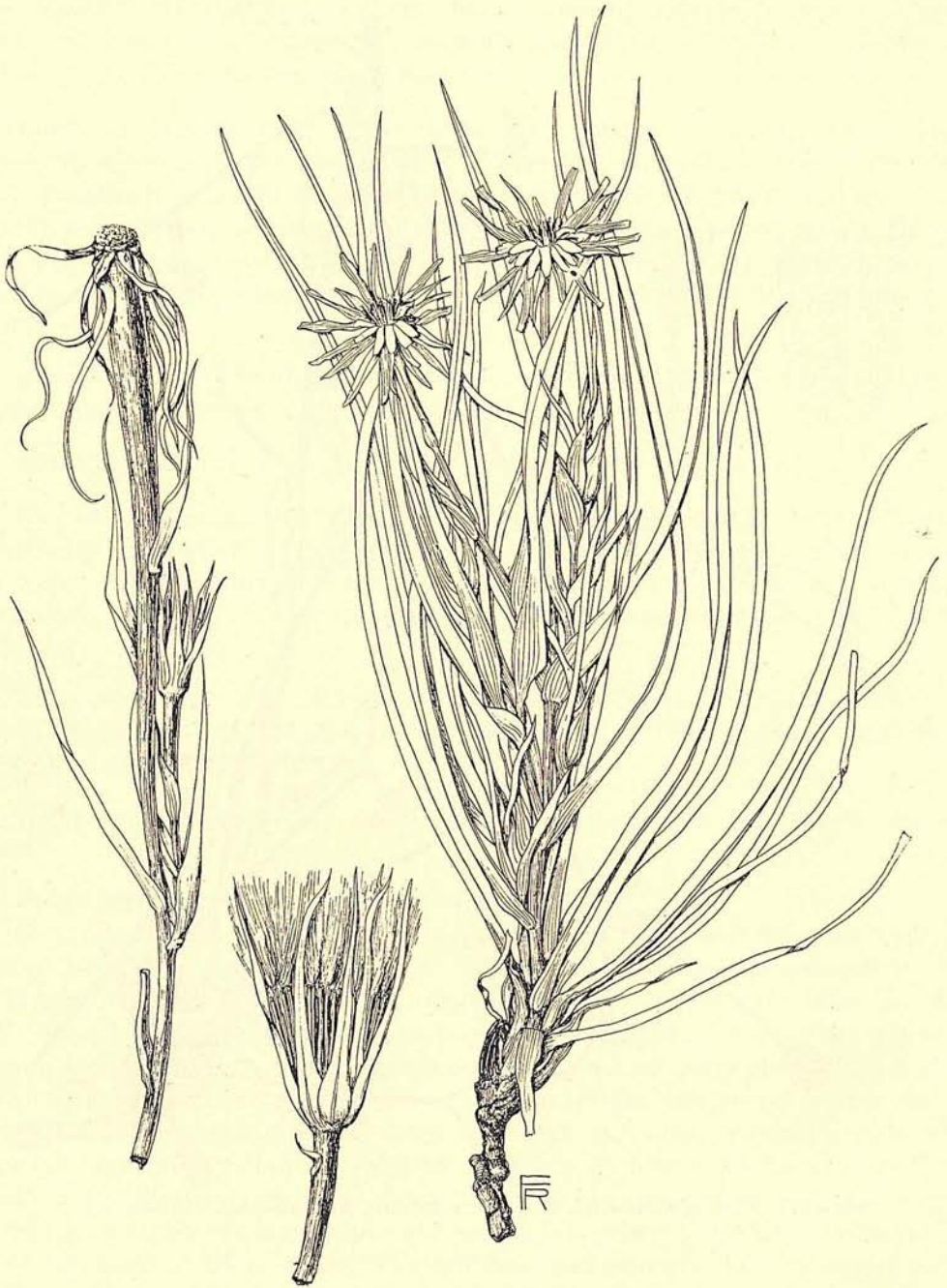
Fig. 128. Links: Tragopogon afghanicus (Kz. 13798 — oberer Stengelteil eines Fruchtexemplares und Fruchtköpfchen). Rechts: T. collinus (K. 3711). \frac{1}{2} .